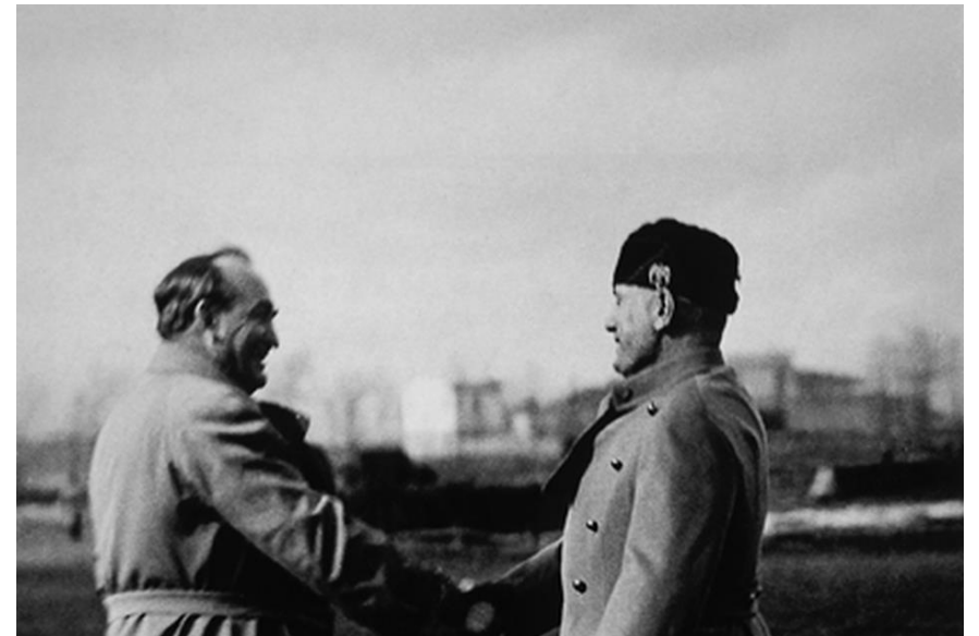
Gömbös és Mussolini