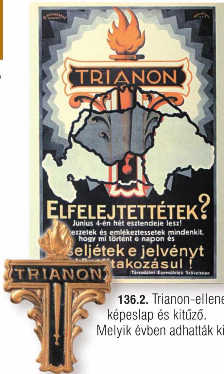
136.2. Trianon-ellenes képeslap és kitűző. Melyik évben adhatták ki?